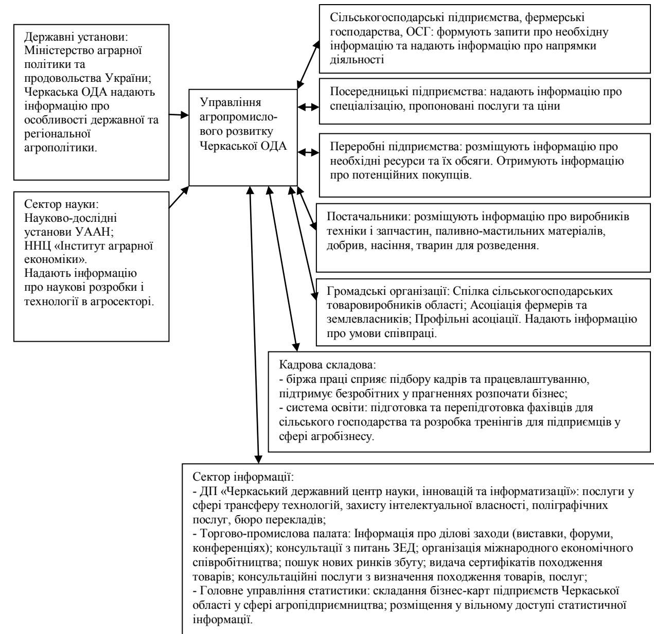
Рис. 1. Система взаємозв'язків між елементами інформаційно-консультативного забезпечення аграрного підприємництва Черкаської області

Складено та доповнено авторами на основі даних [6]