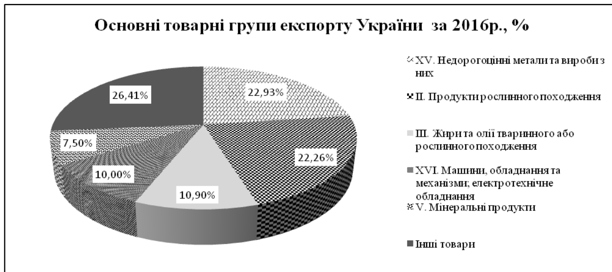
Рис. 1. Основні товарні групи експорту України за 2016 р.

У 2016 році основні групи товарів, які йшли на експорт в Україні були такими (див. рис. 1):