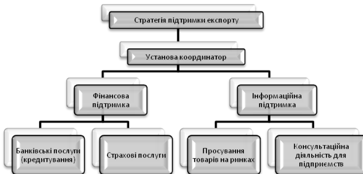
Рис. 2. Модель побудови системи підтримки експорту розвинених країн Розроблено автором

З врахуванням вищезазначених проблем, а також світового досвіду, було прийнято Закон України №1792-19 від 20.12.2016 «Про забезпечення масштабної експансії експорту товарів (робіт, послуг) українського походження шляхом страхування, гарантування та здешевлення кредитування експорту». [1] Основою метою прийняття цього Закону є створення в Україні Експортно-кредитного агентства, яке повинне виконувати такі завдання: