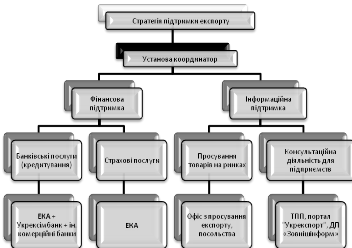
Рис. 3. Система підтримки експорту в Україні