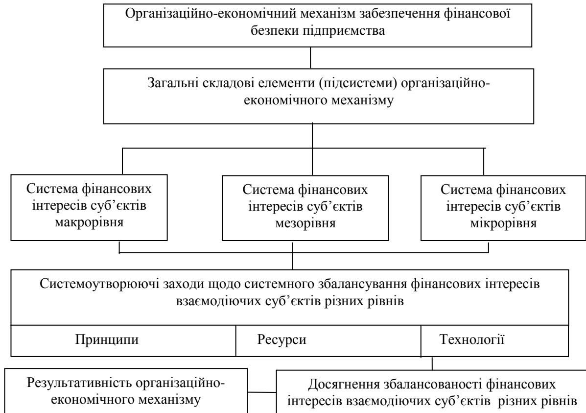
Рис. 1. Концептуальний підхід до формування структурно-логічної моделі механізму забезпечення фінансової безпеки підприємства

Побудова організаційно-економічного механізму, що дозволяє ефективно впливати на підприємство, повинна складатися з таких дій :