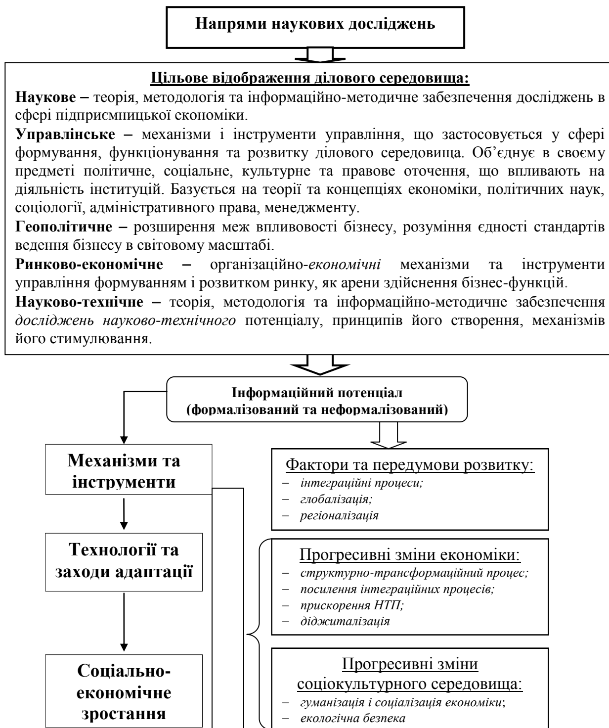
Рис. 3. Цільове відображення ділового середовища в наукових дослідженнях