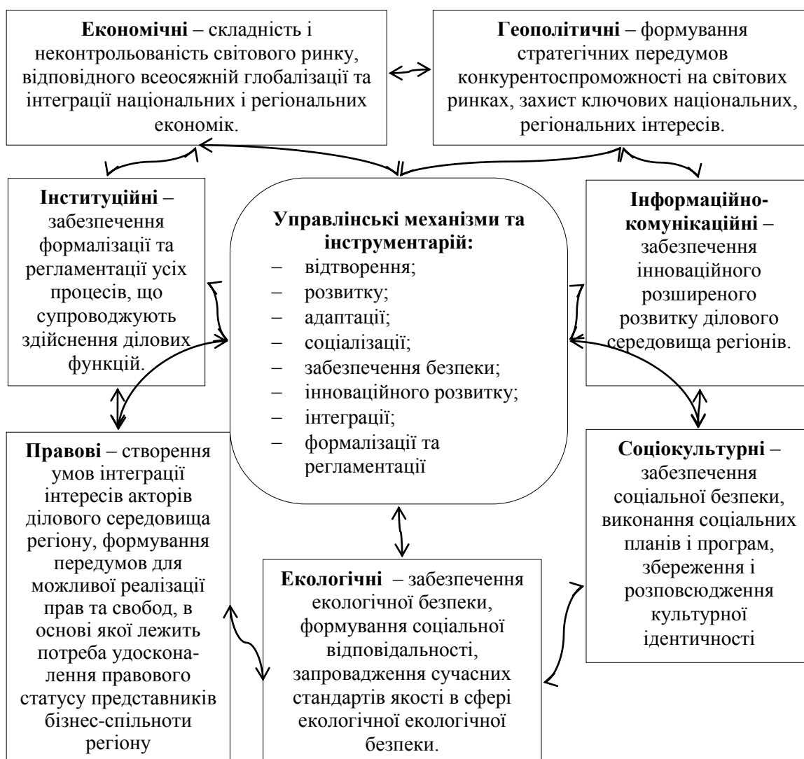
Рис. 2 Формалізація інтересів як рушійної сили розвитку ділового середовища регіону

Регіональні інтереси, необхідно вивчати з позиції їх пріоритетності для національної економіки, формування здорового ділового середовища регіону (рис. 2).