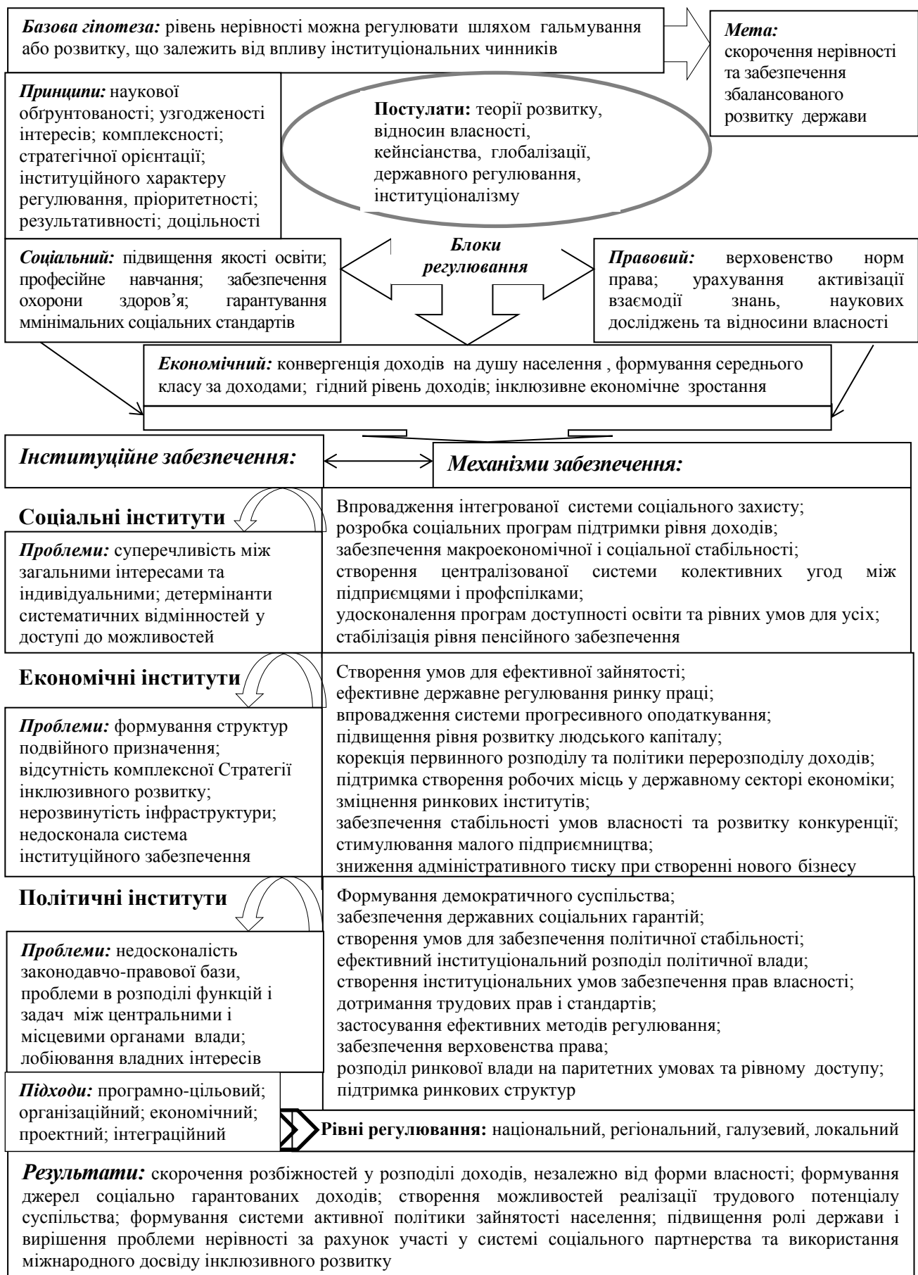
Рис. 2. Діалектично-логічні основи системи скорочення соціально-економічної нерівності в Україні