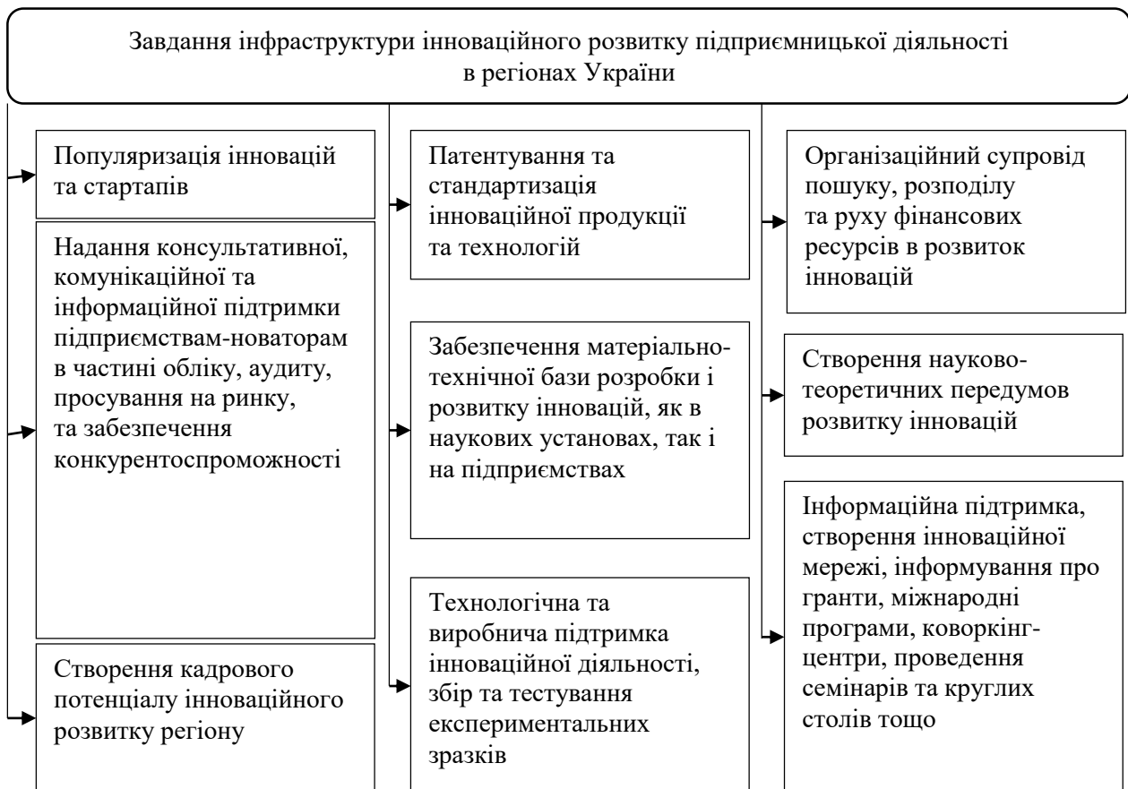
Рис. 1. Завдання інфраструктури інноваційного розвитку підприємницької діяльності в регіонах України

Процес забезпечення інвестиційно-інноваційного розвитку є динамічним, що зумовлено мінливістю інноваційних розробок, динамічністю ринкових відносин та гнучкістю інвестиційних процесів. На кожному етапі розробки та реалізації напрямків забезпечення інвестиційно-інноваційного розвитку підприємництва в регіонах України мають бути враховані елементи їх пластичності та можливості оперативно та адекватно реагувати на зміни в ринковій, науковій та технічній кон'юнктурі, проте знаходитися виключно в межах основних державних політик.