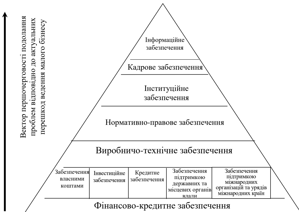
Рис. 3. Ієрархія цілей розвитку малого підприємництва крізь призму видового забезпечення