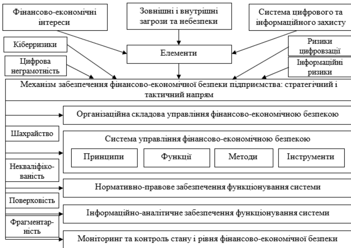
Рис. 2. Механізм забезпечення фінансово-економічної безпеки підприємства з урахуванням ризиків Індустрії 4.0