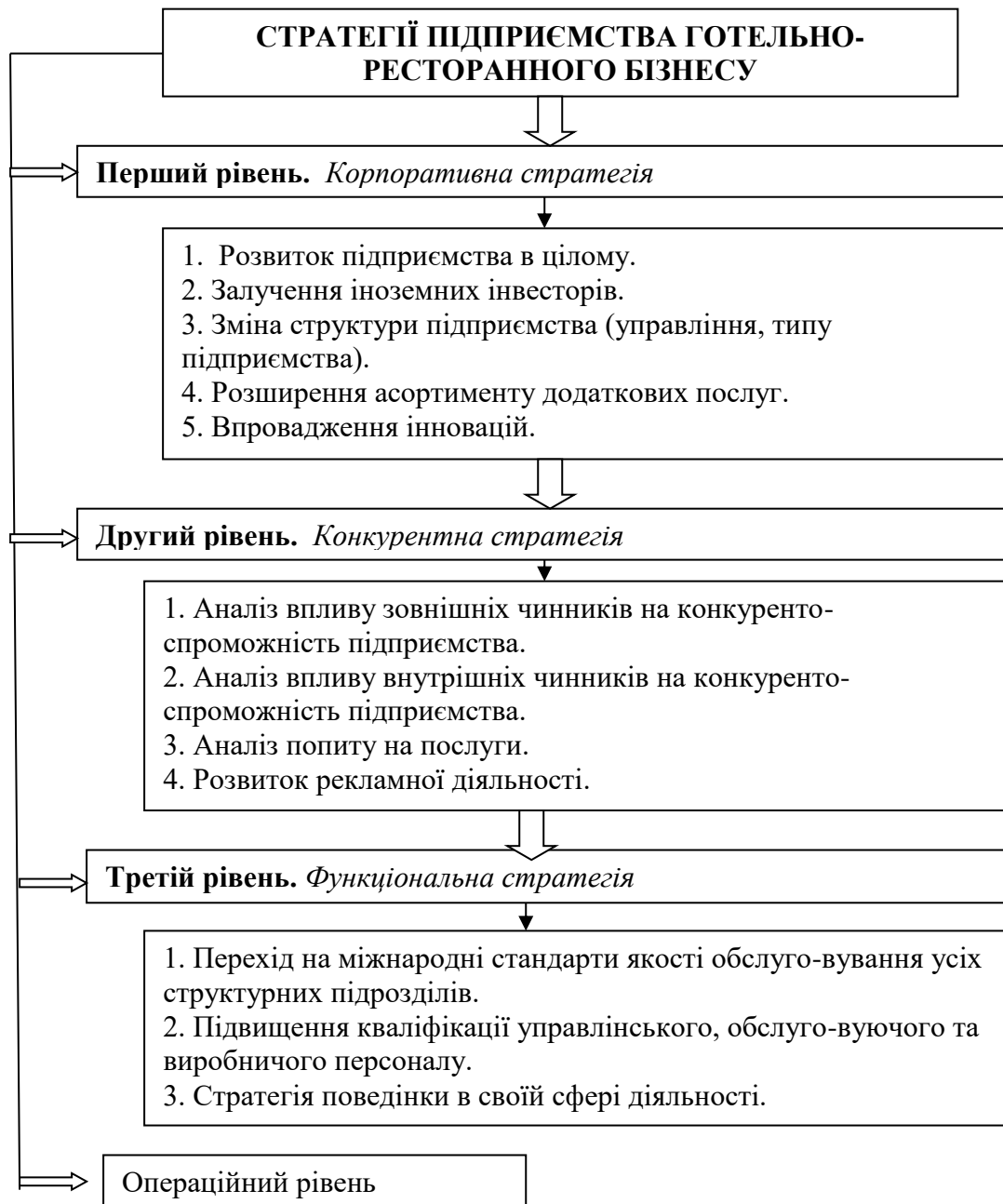
Рис. 3. Ієрархія стратегій підприємств готельно-ресторанного бізнесу Полтавської області Сформовано автором.

Завдяки розробленим стратегіям, підприємства готельно-ресторанного бізнесу зможуть покращити ефективність діяльності та підвищити конкурентоспроможність на ринку готельно-ресторанних послуг досліджуваного регіону.